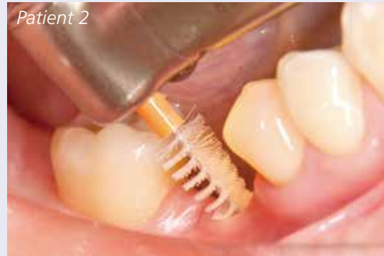
Abb. 4: Rotobürstchen im Einsatz.