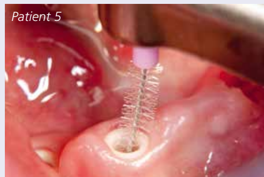
Abb. 10: Die Bürstchen gibt es in verschiedenen Borsten- und Drahtkerndurchmessern.