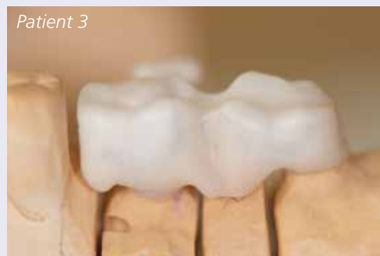
Abb. 6: Bereits im Zirkongerüst angelegte Wege für die Reinigung mit Interdentalbürsten.