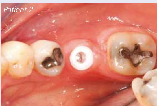
Abb. 5: Gereinigte Situation vor dem Verkleben des Abutments.