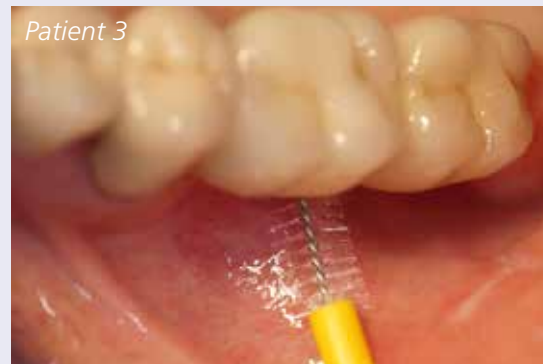
Abb. 8: Bürstchen beim Einsatz im Mund.