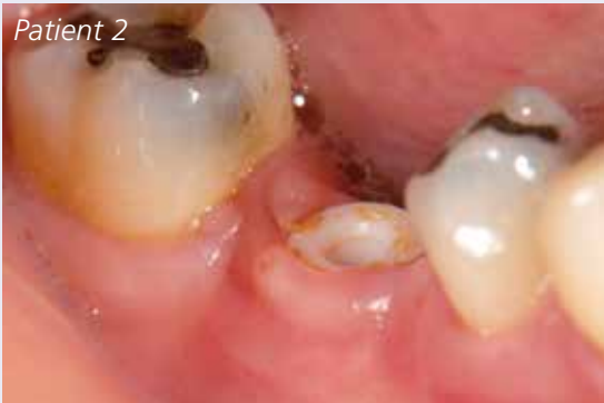
Abb. 3: Zirkonimplantat nach Entnahme des Healing Caps.