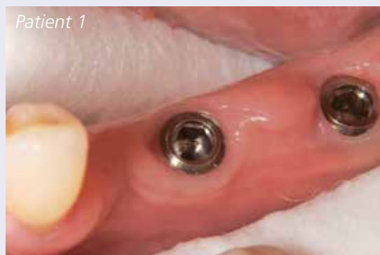
Abb. 2: Gereinigte Anschlussgeometrie.