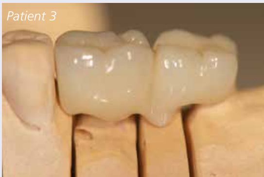
Abb. 7: Fertige Kronen – die angedeuteten Wurzeln haben ein natürliches Aussehen und dienen als Führung für die Interdentalbürsten.